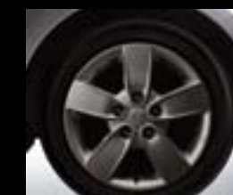
Roues en alliage de 16 po