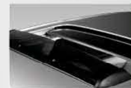
Déflecteur de toit ouvrant