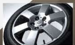
Jantes en alliage de 17 po