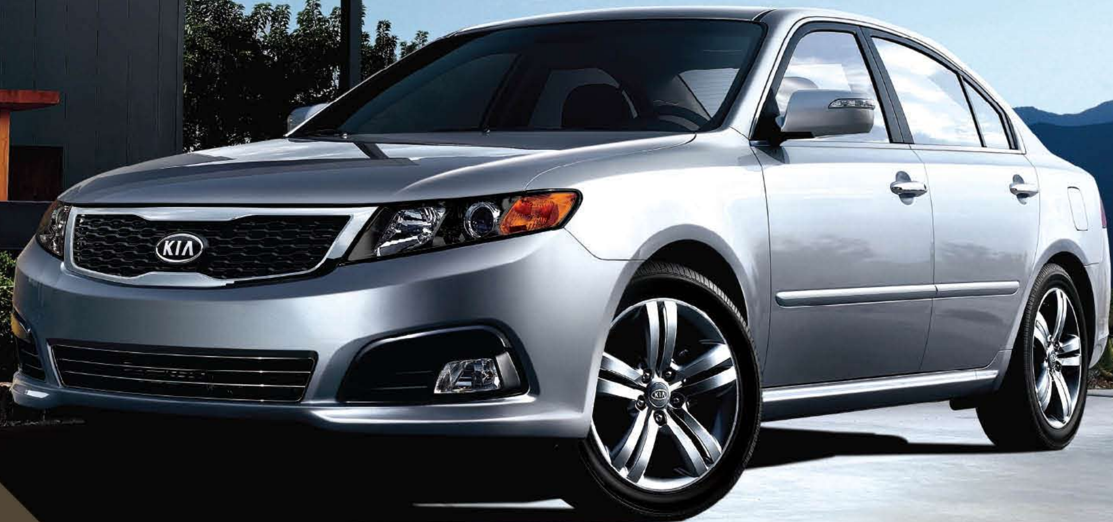
Magentis SX-V6 couleur Argent scintillant métallisé illustrée.

Cette personnalité sportive s'exprime par les contours de phares noirs, la calandre noire, les jantes en alliage argenté de 17 pouces et la suspension à réglage sport, de série. L'intérieur de la SX-V6 regorge de caractéristiques élégantes de série comme les pédales à réglage électrique et la chaîne audio haut de gamme à haut-parleurs Infinity MC .