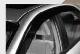
Visières de glaces sport