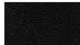
Tissu noir (TN)