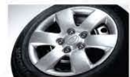
Jantes en acier de 16 po avec enjoliveurs pleine roue