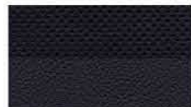
Cuir noir (CN)