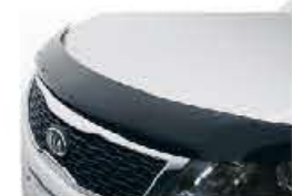
Déflecteur de capot