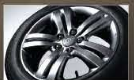
Jantes en alliage argenté de 17 po

TN = Tissu noir, CN = Cuir noir, M = Peinture métallisée, N = Peinture nacré