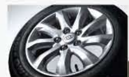
Jantes en alliage de 16 po